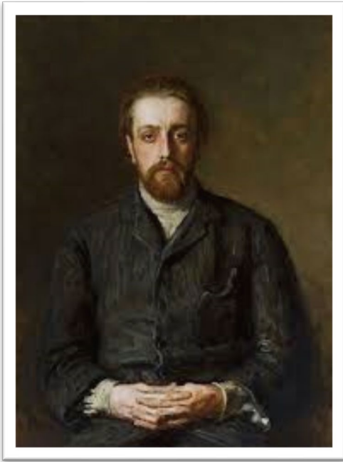
Портрет В.Г. Черткова. И.Е. Репин. Начало 1880-х годов