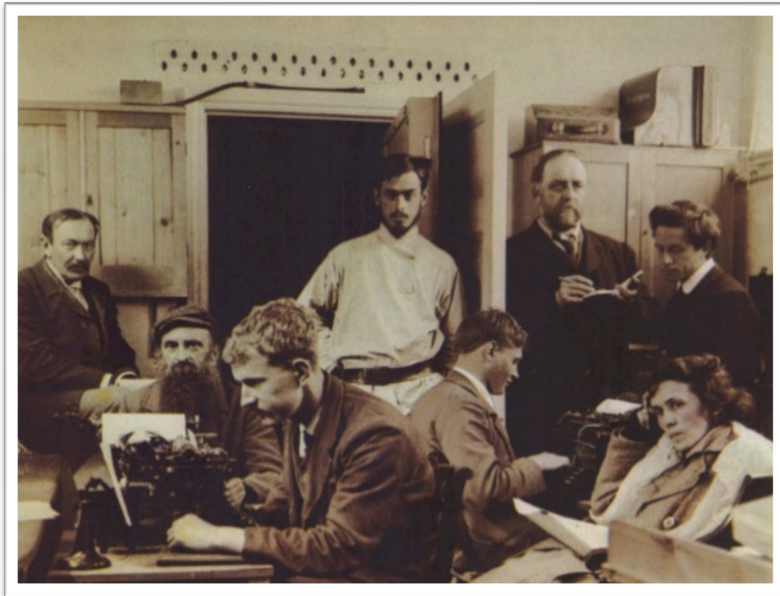
В.Г. Чертков и сотрудники издательства 'Свободное слово'. Англия. 1906 г.

После разорения и расселения духоборов по пустынным гористым местам Кавказа, где их ждала гибель, Чертков стал широко распространять в обществе и среди высших правительственных лиц свою статью 'Напрасная жестокость' 6 об облегчении участи духоборов и вообще всех, отказывающихся от исполнения воинской повинности по религиозным убеждениям. В свое время эту статью Чертков доставил государю Александру III. На государя она произвела благоприятное впечатление, следствием чего заключение 'отказников' в дисциплинарные батальоны заменили ссылкой в Якутскую область на определенный срок 7 .