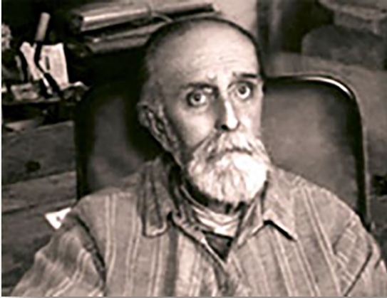
В.Г. Чертков. Начало 1930-х годов.

Если бы Черткова не было, его надо было бы придумать. Для меня по крайней мере, для моего счастья.