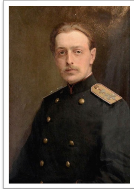
Портрет В.Г. Черткова. И.Н. Крамской. Конец 1870-х годов

В октябре 1883 года Чертков, будучи 29 лет от роду, приехал к великому учителю, чтобы предложить все свои силы и энергию в его распоряжение и очень скоро стал не только секретарем, но и самым близким другом Толстого, несмотря на двадцатилетнюю разницу в возрасте. Сближение со Львом Николаевичем для Черткова имело исключительное значение. ‘...Я в нем обрел, – писал он, – ничем незаменимую помощь в моем дальнейшем внутреннем развитии’.